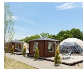
那須ハミルの森(栃木県那須)