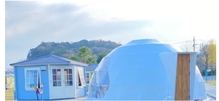
1組ずつ専用のBBQハウスとドームテント