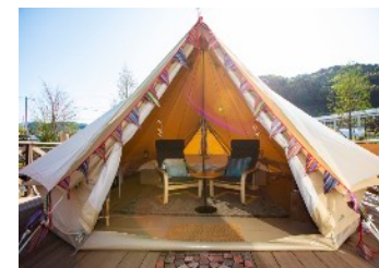
UFUFU VILLAGE (伊豆市)