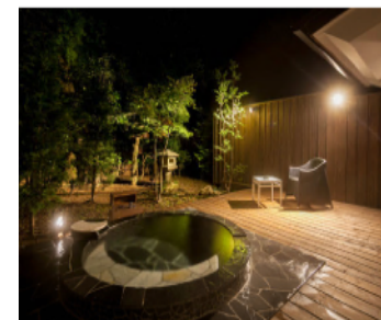
月ヶ瀬温泉 雲風々 (伊豆市)