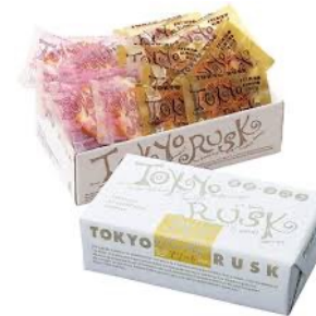
代表商品「東京ラスク」