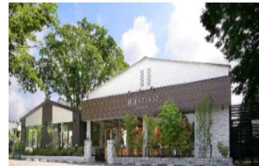
観光地那須ラスクテラス