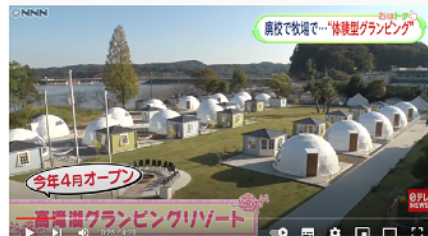
Oha!4 NEWS LIVE