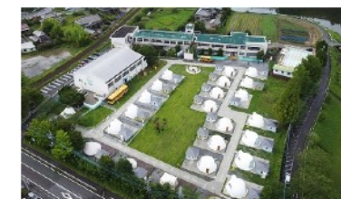
高滝湖グランピングリゾート(市原市)